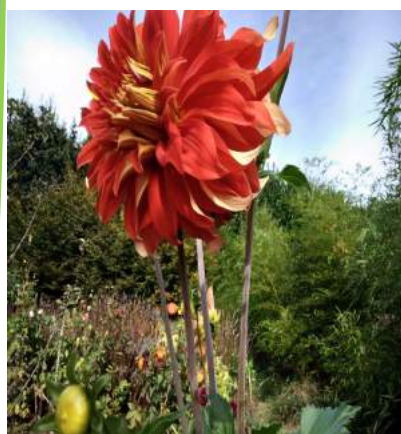
Un Dahlia géant au milieu d'un potager