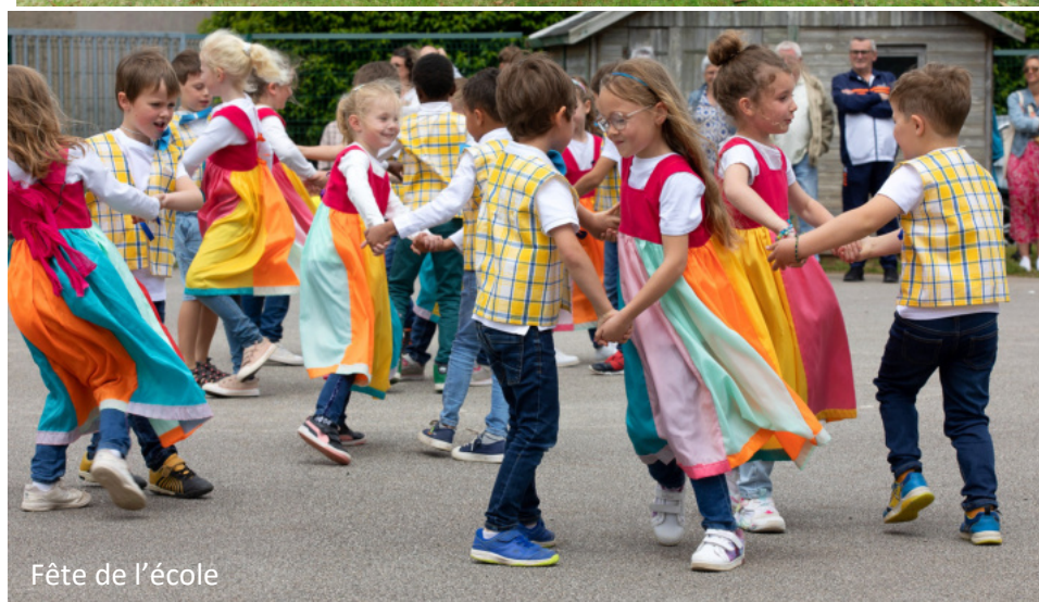
Fête de l'école