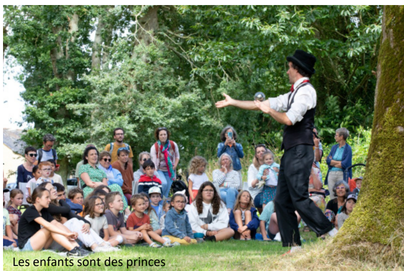
Les enfants sont des princes