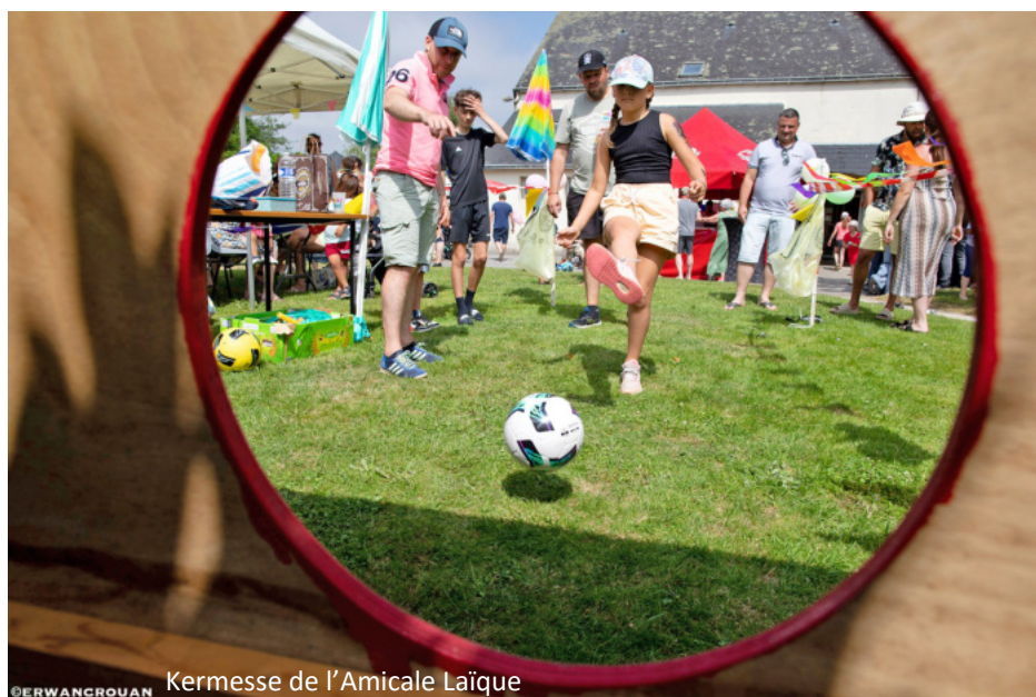
Kermesse de l'Amicale Laïque

Soutien logistique et financier aux associations (Amicale Laïque, Concours équestre d'endurance, Pardon de Ker-goat, From Fest, Cheval Breton, Manotopia, Les enfants sont des princes, etc.) ; inauguration d'une plaque Place de la Résistance, en mémoire des déportés et résistants de la commune.