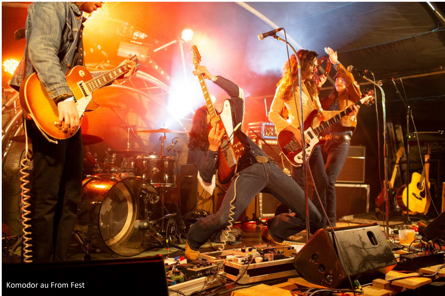
Komodor au From Fest