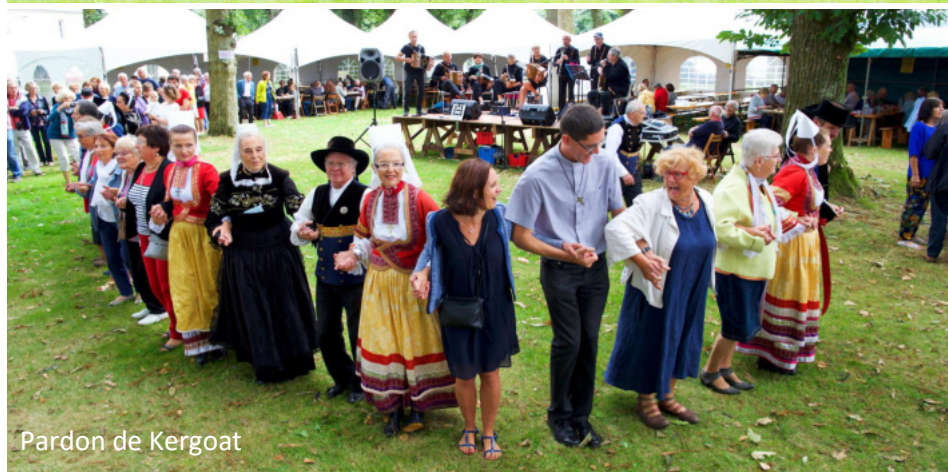
Pardon de Kergoat